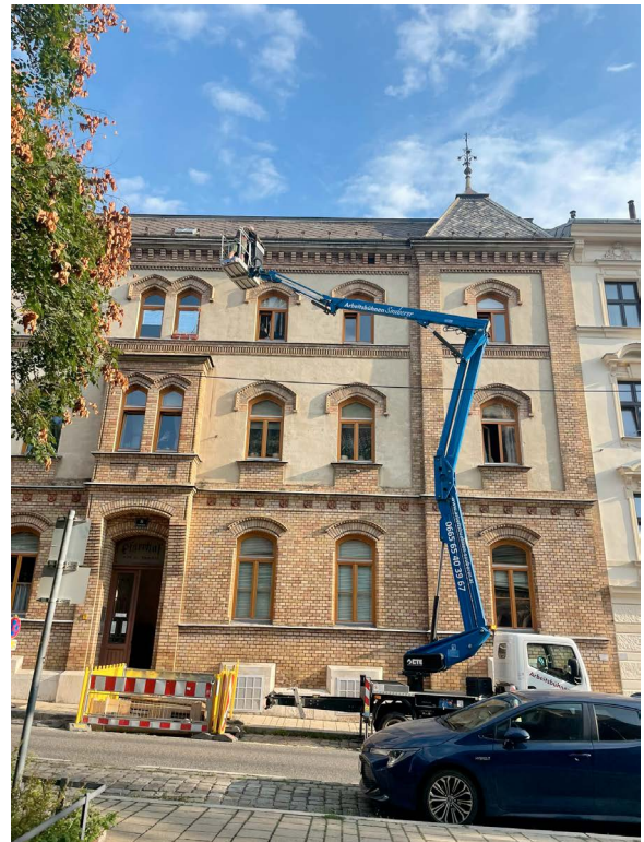
Befundung durch Experten im August 2024 - leider viel zu sanieren

Um den Verbrauch von Gas zu reduzieren (ca. 25 %) wird die Hoffassade sowie die Dachgeschoßdecke des Pfarrheims thermisch saniert. Der komplette Ausstieg aus Gas (Beheizung durch eine Luftwärmepumpe) scheidet derzeit leider an den zu hohen Adaptierungskosten der Heizkörper und Rohrleitungen. Zeitgleich werden die letzten Kastenfenster getauscht, das Garagentor erneuert, die Begrenzungsmauer Richtung Speckbachergasse sowie die Kaminköpfe saniert, ein Sonnensegel zur Beschattung des Innenhofes montiert und eine Blitzschutzanlage installiert. Die dafür nötige Entrümpelung des Kellers und des Dachbodens erfolgte bereits im August.