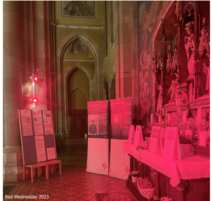
Red Wednesday 2023